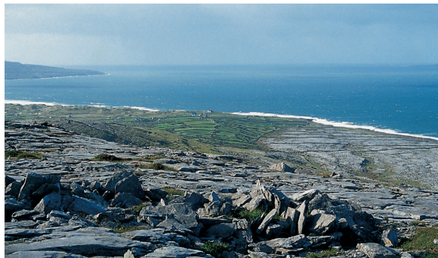
Kalksteine in allen Formen und Größen dominieren das Landschaftsbild des Burren.