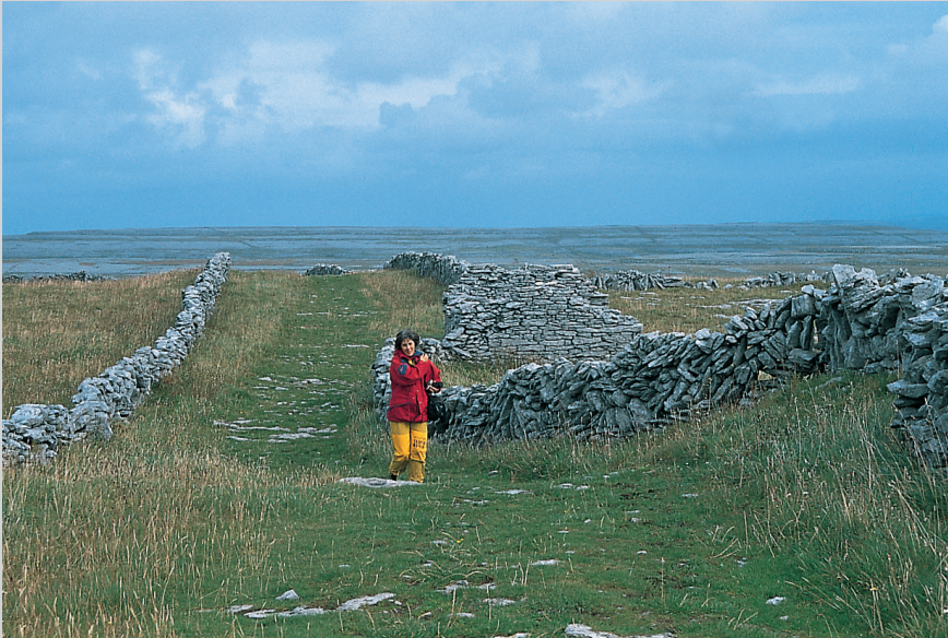
Auf dem Fernwanderweg »Burren Way«.